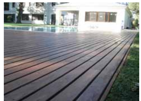
Bonaデッキオイルで保護された屋外デッキ